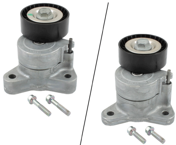
Figura 1: Brațul de tensionare 534 0325 10 – Stânga, versiunea veche, cu șuruburi de fixare. Dreapta, noua versiune, cu șuruburi de fixare.

În cadrul eforturilor noastre continue de a ne îmbunătăți produsele, am făcut modificări la brațul de tensionare 534 0325 10.