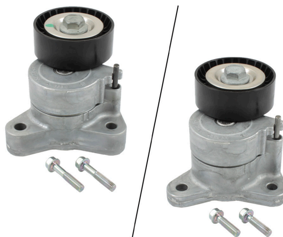
Рисунок 1: Натяжная планка 534 0325 10 Слева, старое исполнение с крепежными винтами M8x40, справа, новое исполнение с крепежными винтами M8x30.

Натяжная планка 534 0325 10 была модифицирована в рамках постоянного стремления компании к улучшению качества продукции.