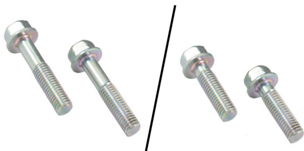
Рисунок 4: Слева, прежние болты М8х40 мм. Справа, новые болты М8х30 мм.

Существенно важно, чтобы использовались болты из комплекта упаковки при монтаже модифицированной натяжной планки.