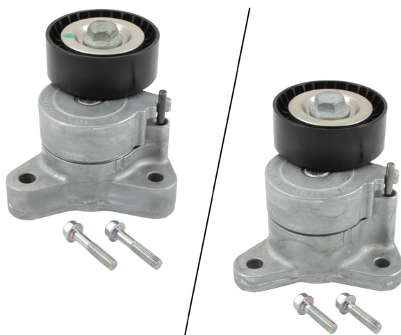
Bild 1: Spännarm 534 0325 10 - vänster tidigare utförande med fästskruvar. Höger, nytt utförande med fästskruvar

Inom ramen för fortlöpande utveckling av våra produkter, har spännarm 534 0325 10 ändrats.