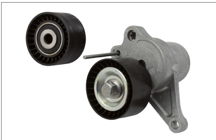
Obrázok 2: Napínacia remenica a vodiaca kladka z plastu

Napínacie a vodiace kladky z kovu možno bez obmedzenia zameniť za vyhotovenie z plastu.