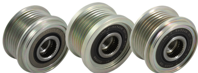
Billede 2: Friløbsremskiver 535 0063 10 (venstre), 535 0202 10 (midt), 535 0203 10 (højre)

Der produceres muligvis vibrationer og høje lyde fra frontens ekstradrev i de nedenstående køretøjer med en stiv generatorremskive. Disse vibrationer og lyde forårsages af omdrejningsuregelmæssigheder i dieselmotoren, der er større end i benzinmotorer.