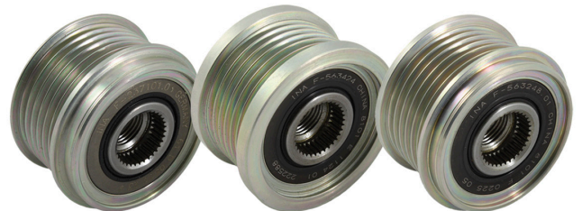
Εικόνα 2: Τροχαλίες δυναμό με κασάνια 535 0063 10 (αριστερά), 535 0202 10 (κέντρο), 535 0203 10 (δεξιά)

Στα οχήματα που αναφέρονται παραπάνω με άκαμπτη τροχαλία ιμάντα δυναμό μπορεί να δημιουργηθούν κραδασμοί και δυνατοί θόρυβοι από τον ιμάντα αξεσουάρ. Αυτοί οι κραδασμοί και οι θόρυβοι προκαλούνται από τις ανωμαλίες περιστροφής στον κινητήρα diesel, οι οποίες είναι μεγαλύτερες από αυτές στον βενζινοκινητήρα.