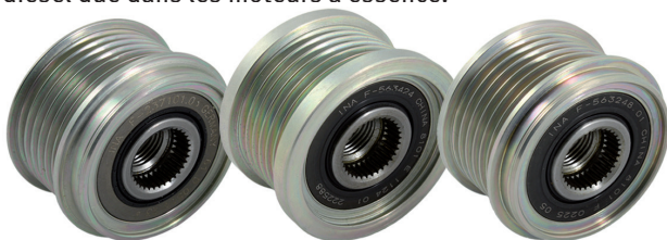
Fig. 2 : Poulies à roue libre d'alternateur réf.: 535 0063 10 (à gauche), réf. : 535 0202 10 (au milieu), réf. : 535 0203 10 (à droite)

Dans les véhicules équipés d'une poulie rigide désignés ci-dessus, il peut y avoir des vibrations et des bruits gênants provenant du système d'entraînement des accessoires périphériques. Ces derniers sont générés par des irrégularités cycliques plus importantes dans les moteurs diesel que dans les moteurs à essence.