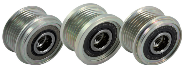
Figura 2: Ruote libere alternatore 535 0063 10 (sinistra), 535 0202 10 (centro), 535 0203 10 (destra)

Schaeffler Automotive Aftermarket consiglia di modificare la puleggia rigida dell'alternatore dei veicoli interessati in ruota libera alternatore. Attenzione: attenersi assolutamente alle Istruzioni di montaggio allegate!