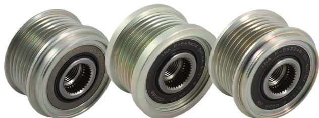
Figur 2: Friløpsremskive OAP 535 0063 10 (venstre), 535 0202 10 (midten), 535 0203 10 (høyre)

Vibrasjoner og høye lyder fra aggregatdriften kan produseres i kjøretøyene oppført ovenfor med en stiv generatorremskive. Disse vibrasjonene og høye lydene er forårsaket av rotasjonsuregelmessighetene i dieselmotoren, som er større enn de i en bensinmotor.