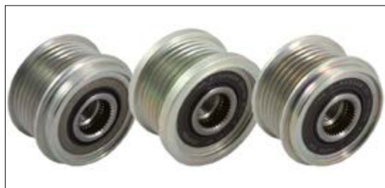
Foto 2: Wolne koło pasowe alternatora 535 0063 10 (po lewo), 535 0202 10 (na środku), 535 0203 10 (po prawo)

W wymienionych powyżej pojazdach ze sztywnym kołem pasowym alternatora mogą występować wibracje i niepożądane odgłosy dochodzące z napędu pomocniczego. Powstają one na skutek nierównomiernych obrotów silnika Diesla, które są większe niż w przypadku silników benzynowych.