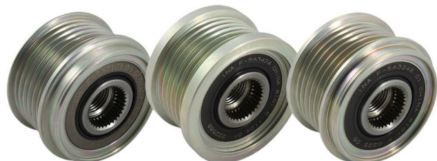
Figura 2: Roți de curea libere ale alternatorului 535 0063 10 (stânga), 535 0202 10 (centru), 535 0203 10 (dreapta)

La vehiculele menționate mai sus, la care roata de curea a alternatorului este rigidă, este posibil să apară vibrații și zgomote deranjante din mecanismul de antrenare a agregatelor secundare. Aceste vibrații și zgomote sunt produse de neuniformitatea rotației din motoarele diesel, care este mai accentuată decât la cele pe benzină.