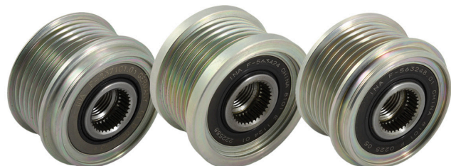
Рисунок 2: Шкив генератора с обгонной муфтой 535 0063 10 (слева), 535 0202 10 (центр), 535 0203 10 (справа)

В указанных автомобилях, оборудованных жестким шкивом генератора, могут возникать вибрации и сильные шумы в системе натяжения ремня привода навесных агрегатов. Данные вибрации и шумы вызваны неравномерностью вращения дизельного двигателя, которая больше, чем в бензиновом двигателе.