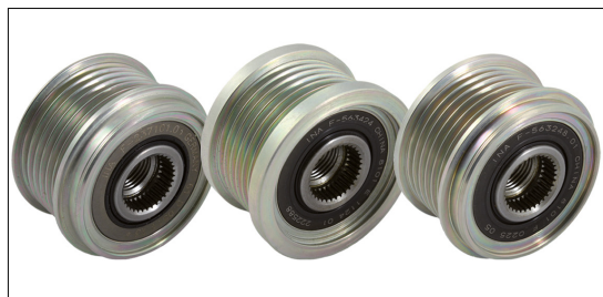
Obrázok 2: Alternátorová voľnobežka 535 0063 10 (vľavo), 535 0202 10 (uprostred), 535 0203 10 (vpravo)

V prípade vyššie uvedených vozidiel s tuhú remenicou alternátora môže dochádzať k vibráciám a rušivým hlukom z oblasti pohonu prídavných agregátov. Tie vznikajú v dôsledku oveľa väčšej nerovnomernosti rýchlosti otáčania v prípade vznetrových motorov v porovnaní so zážihovými motormi.