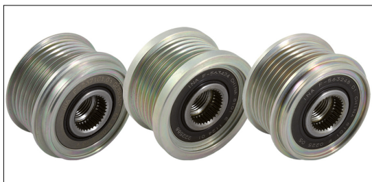
Slika 2: Jermenice alternatorja s sklopko za prosti tek: 535 0063 10 (na levi), 535 0202 10 (na sredini) in 535 0203 10 (na desni)

Jermenica alternatorja s sklopko za prosti tek loči vzporedni pogon v sprednjem delu vozila od neenakomernosti hitrosti vrtenja motorja, kar zagotavlja, da rebrasti klinasti jermen teče bolj gladko in tiho. Zaradi tega je motor tišji, vožnja pa udobnejša.