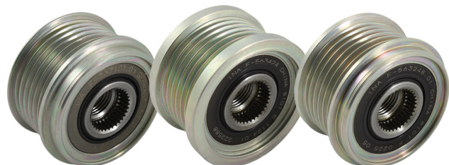
Bild 2: Generatorfrinav 535 0063 10 (vänster), 535 0202 10 (i en mitt), 535 0203 10 (höger)

Vibrationer och störande oljud från aggregatdriftens område, kan uppstå hos ovan angivna fordon med fast remskiva på generatorm. Dessa uppstår som följd av långt större ojämnheter i varvtalet hos dieselmotorer, jämfört med bensinmotorer.