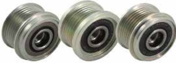
Şekil 2: 535 0063 10 (sol), 535 0202 10 (orta), 535 0203 10 (sağ) devir ayarlı alternatör kasnağı

Yardımcı tahrik sisteminden gelen titreşim ve sesler yukarıda belirtilen rijit bir (geleneksel) kayış kasnağı ile donatılmış araçlarda meydana gelebilir. Bu titreşim ve sesler dizel motorlarda benzinli motordan daha yüksek olan dönüş düzensizliklerinden kaynaklanır.