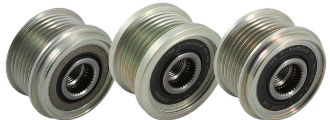
Зображення 2: Шків генератора з обгінною муфтою 535 0063 10 (зліва), 535 0202 10 (посередині), 535 0203 10 (справа)

У наведених вище автомобілях, в яких встановлений жорсткий шків генератора, можуть виникати вібрації та надокучливі шуми в області приводу допоміжних агрегатів двигуна. Вони виникають внаслідок нерівномірного обертання колінчастого вала дизельного двигуна у порівнянні з бензиновим двигуном.