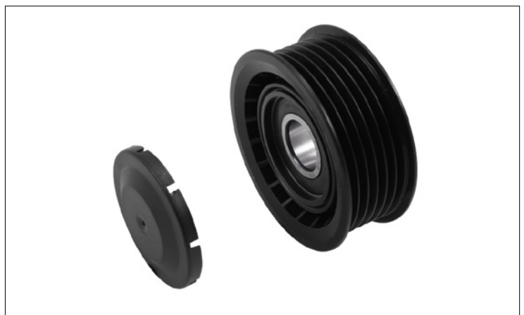
Fig. 1: Uitvoering 1

Het belangrijkste onderscheid is de voorste afdekschijf en de extra vulring bij de uitvoering in Fig. 2. Om de multiriem goed uit te lijnen, moet de meegeleverde ring beslist tussen motorblok en geleiderol worden aangebracht.