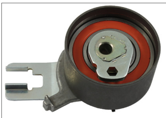
Fig. 2: 531 0515 10 – Polea tensora antigua

Las piezas de recambio e información técnica se pueden encontrar en www.schaeffler-aftermarket.com o en www.RepXpert.com .