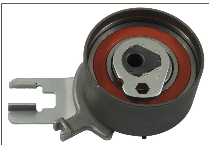
Slika 1: 531 0859 10 – nova remenica natezača

30638278 (zamjenjen) 30677134 (zamjenjen) 30731774 (zamjenjen) 31316658 (zamjenjen) 31316999 (zamjenjen) 31339542 (novi) 31258305 (KIT, zamjenjen) 31330188 (KIT, zamjenjen) 31359568 (KIT, novi)