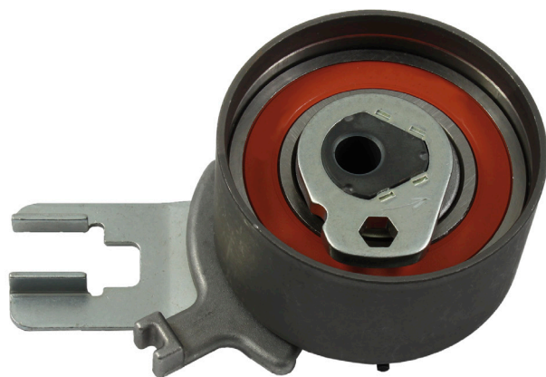
1. ábra: 531 0859 10 – új feszítőgörgő