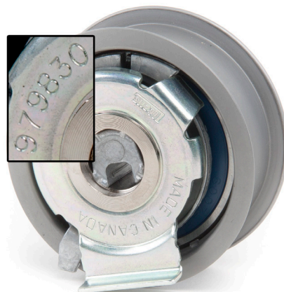
Obr. 2: 531 0851 10 – nová napínací kladka (979830)

Na základě změněných specifikací nahrazuje napínací kladka 531 0851 10 napínací kladku 531 0777 10.