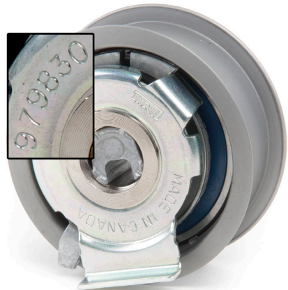
2. ábra: 531 0851 10 – új feszítőgörgő (979830)

A 979743 számú feszítőgörgő beszerelése a 979830 számú feszítőgörgő helyére nem engedélyezett!