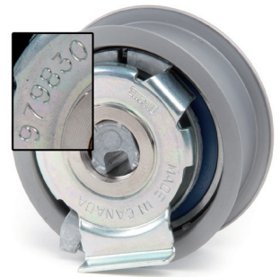
Fig. 2: 531 0851 10 – nieuwe spanrol (979830)

Vanwege gewijzigde specificaties vervangt de spanrol 531 0851 10 de spanrol 531 0777 10.