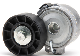
Slika 1: Stara (prethodna) izvedba