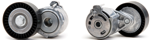
Зображення 2: Нова версія

В рамках постійного вдосконалення нашої продукції було здійснено модифікацію натяжного ролика з артикульним номером 534 0110 20.