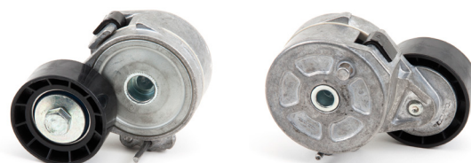
Obrázek 1: staré provedení