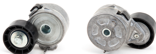
Εικόνα 1: Προηγούμενος σχεδιασμός