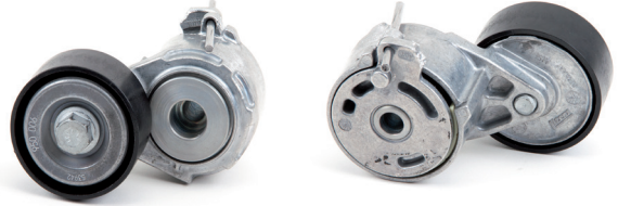
Resim 2: Yeni tasarım

Ürünlerimizi geliştirmeye yönelik çalışmalarımızın bir parçası olarak, 534 0111 20 parça numaralı kayış gergisinde değişiklikler yapılmıştır.