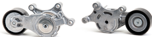
Obrázek 2: nové provedení

Na základě trvalého dalšího vývoje našich produktů byla modifikována alternátorová volnoběžka s objednávacím číslem 534 0075 20.