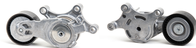
Slika 2: Nova izvedba

Kao dio kontinuiranog usavršavanja i poboljšanja naših proizvoda, izvršene su preinake na natezaču remena 534 0075 20