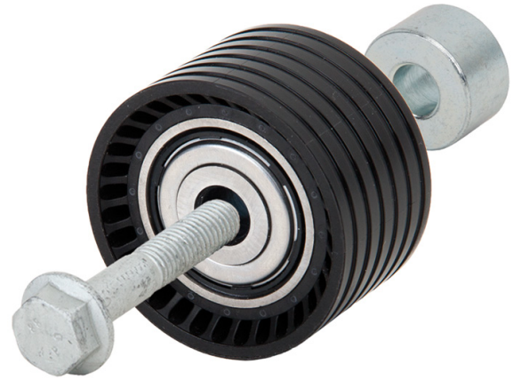
Kuva 2: 532 0654 10 – ohjainpyörä uudella tiivistekonseptilla ja muilla asennetuilla osilla

Tuotenumero: 532 0774 10 (uusi) 532 0654 10 (uusi) 532 0221 10 (korvattu)