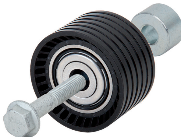
Figura 2: 532 0654 10 – Rullo di rinvio con guarnizioni di nuova generazione e componenti montati

N. art.: 532 0774 10 (attuale) 532 0654 10 (attuale) 532 0221 10 (sostituito)