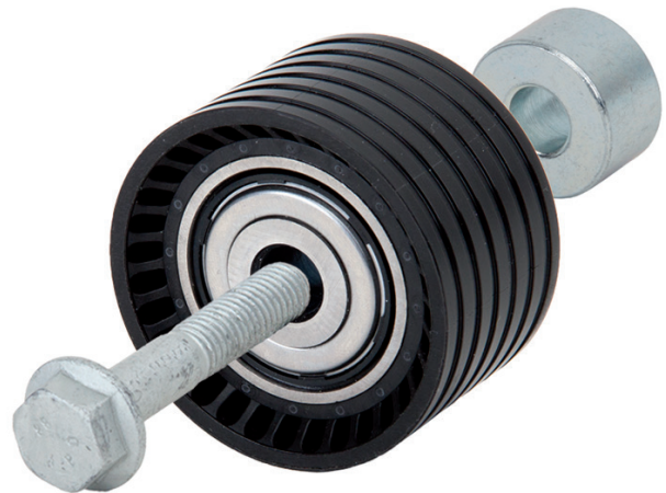
Fig. 2: 532 0654 10 – geleiderol met nieuw afdichtingsontwerp en inbouwonderdelen

Artikelnummer: 532 0774 10 (actueel) 532 0654 10 (actueel) 532 0221 10 (vervangen)