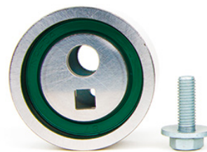
Obrázek 2: 531 0780 10 - napínací kladka INA s příloženým šroubem

www.rexpert.cz, rexpert.cz@schaeffler.com REXPERT portál (registrace, nefunkční heslo) +420 267 298 606 (CZ) Montáž, servis produktů Schaeffler +420 602 240 554 (CZ)