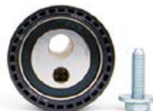
Foto 3: 531 0264 10 - Rolka napinająca INA z dołączoną śrubą

Jeśli tuleja prowadząca zostanie poluzowana trzeba ją dokręcić z siłą odpowiadającą zaleceniom producenta pojazdu.