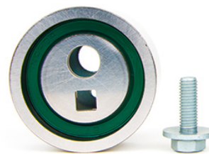
Bild 2: 531 0780 10 - spännrulle från INA med medlevererad skruv

Tel +46 (0)8 595 109 00 Fax +46(0)8 595 109 61 aftermarket.neu@schaeffler.com https://aftermarket.schaeffler.com