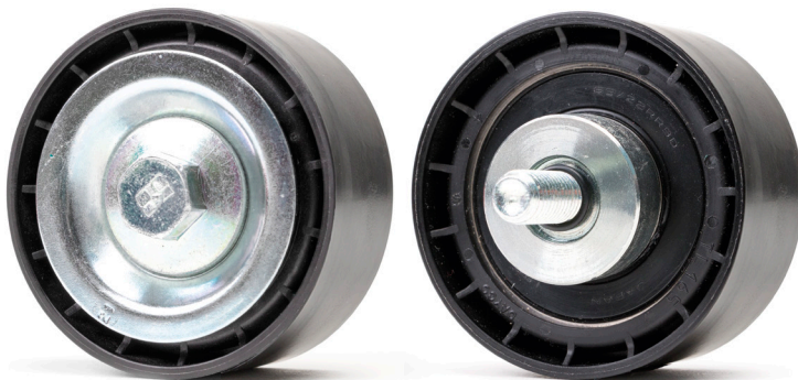
איור 1: עיצוב קודם