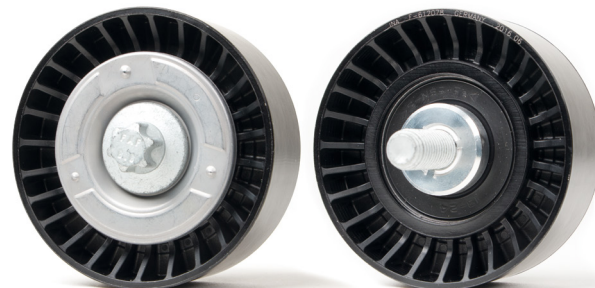
Kuva 2: Uusi versio

Tuotteidemme jatkuvan kehityksen vuoksi modifioitiin ohjainpyörä tilausnumerolla 532 0545 10.