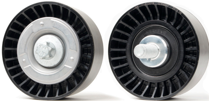
איור 2: עיצוב חדש