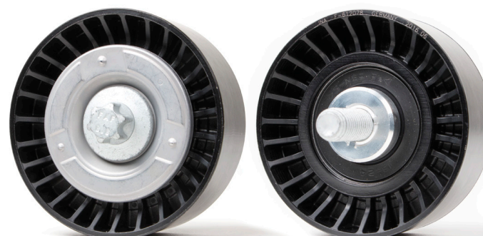
Slika 2: Nova izvedba

Pridržavajte se uputa proizvođača vozila!