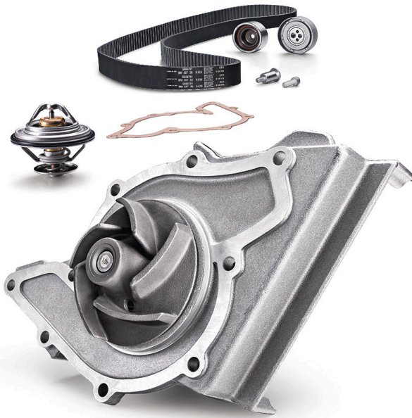
תמונה 2: סט משאבת מים עם אטם נייר שטוח

כאשר אטימת המשאבה נעשית באמצעות אטם נייר שטוח או אטם מסוג טבעת "או" (אורינג), אין להוסיף שום חומר אטימה נוסף במהלך ההתקנה.