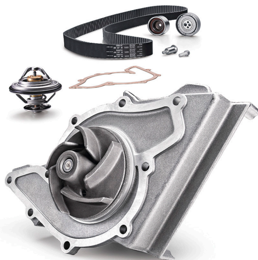
Figura 2: KIT pompă de răcire cu garnitură din hârtie

Utilizarea unui element de etanșare suplimentar va duce la apariția unor deformări asemănătoare unor bile pe secțiunea interioară a părții turnate. Acestea dispar odată cu circulația lichidului de răcire, iar etanșarea suplimentară se înfășoară în jurul axului pompei, între carcasă și rotor. Presiunea lichidului de răcire face ca resturile să pătrundă forțat în garnitura mecanică rotativă (Fig. 1), cauzând cedarea acesteia.