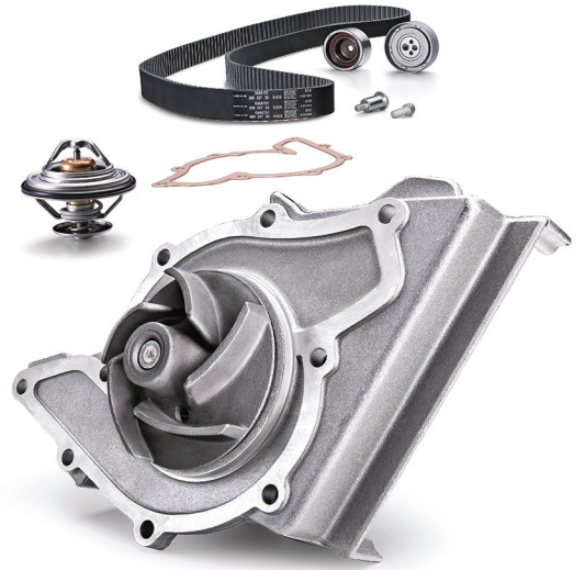
Resim 2: Kağıt contalı soğutma pompası kiti

Yeni bir soğutma pompasını monte etmeden önce yüzeyi hazırlamak ve temizlemek için kazıyıcı ve yumuşak bir ovma pedi kullanın.