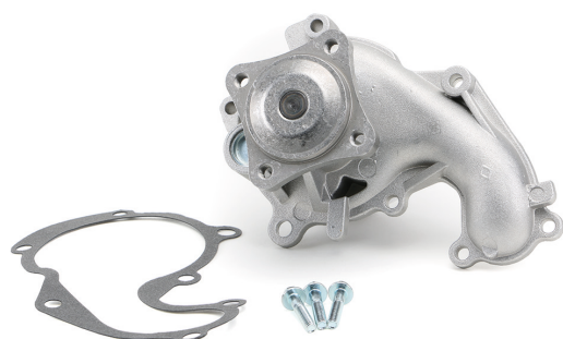
Fig. 1: Conteúdo do kit da bomba de refrigerante

Consulte a atribuição atual nos catálogos