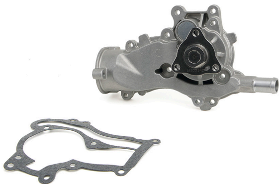
Снимка 1: 538 0314 10 - Помпа за охлаждаща система с придружаващо уплътнение

Ако се използва допълнителен уплътнител по време на монтажа, излишъкът от уплътнителя е притиснат между корпуса на помпата за охлаждащата течност и пластмасовия щит, който се води от потока на охлаждащата течност (снимка 2), причинявайки изкривяване. При работа еcranът се притиска срещу работната перка, уврежда или напълно унищожава щита, което води до повреда на помпата за охлаждаща течност. Отломки от пластмасовия щит преминават през охлаждащата система и могат да причинят последващи повреди.