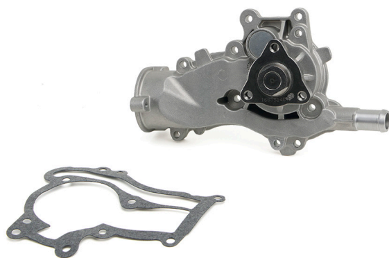
Obrázek 1: 538 0314 10 - čerpadlo chladicí kapaliny s přiloženým plošným těsněním

Čerpadlo chladicí kapaliny 538 0314 10 je utěsněno plochým těsněním, proto se v průběhu montáže nesmí použít ŽÁDNÝ těsnicí prostředek.