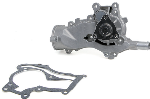
Bild 1: 538 0314 10 - Kühlmittelpumpe mit beiliegender Flachdichtung