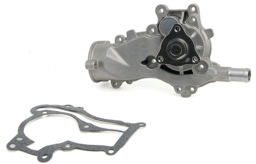
תמונה 1: 10 0314 538 – משאבת מים הכוללת את האטם השטוח

שים לב יש לוודא קיום הנחיות יצרן הרכב בנושא זה!