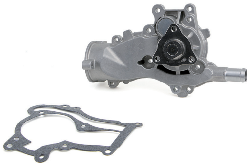
Figura 1: 538 0314 10 - pompa del acqua con guarnizione piatta fornita

Per l'assegnazione attuale, consultare i cataloghi